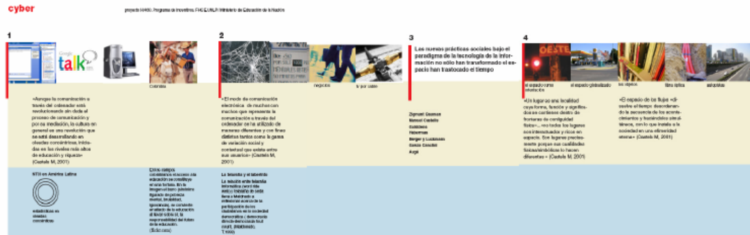
Imagen 1. La capa formada por el área de imagen y el área amarilla constituye el eje discursivo, mientras el área azul es información asociada.

clasificación misma surge la identificación de módulos de contenido. Los módulos de contenido están numerados y por líneas guía en rojo.